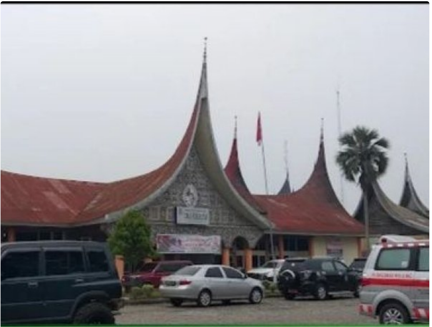
Gambar Dinkes Limapuluh Kota Sumatera Barat

SARILAMAK — Pemerintah Kabupaten Lima Puluh Kota melalui Dinas Kesehatan terus mendorong masyarakat agar tidak menunggu sakit untuk datang ke fasilitas layanan kesehatan. Melalui layanan cek kesehatan gratis di seluruh Puskesmas, deteksi dini kini dijadikan sebagai langkah utama dalam menjaga